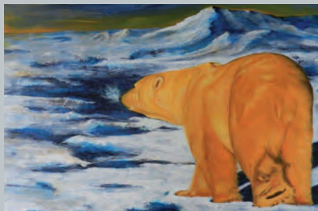
Eisbär, Acryl auf Leinwand, 80 x 100 cm