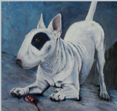
Milky Way, Acryl auf Leinwand, 100 x 120 cm