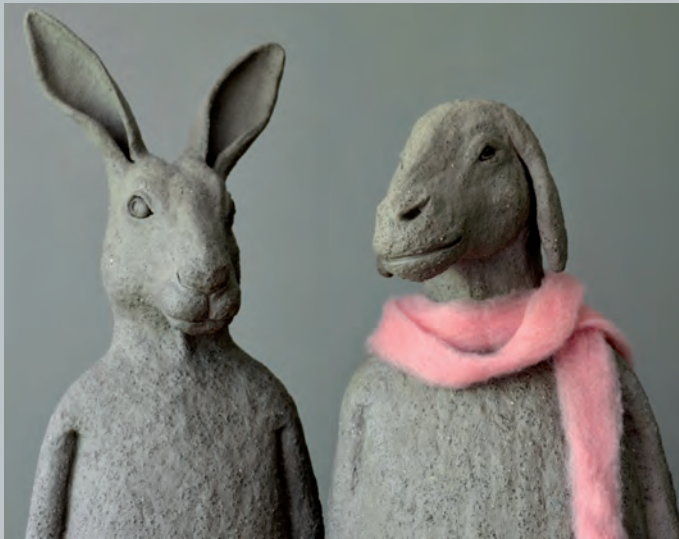
Herr Hase und Frau Schaf, Steinzeug grau

Frau Schaf möchte einen Schal, am liebsten von ihrer eigenen Wolle und rosa muss er sein!